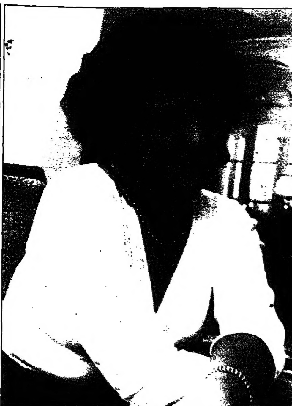
الفنانة المصرية محالي زايد بعد ان وافقت على القيام بدور البطولة في الموسم المسرحي الصيفي القادم في مسرحية قنطرة الإسكندرية بعد كورتينا، أمام محمود عبد العزيز وسعيد صالح حادت وأعدت بعد ان اكتشفت ان عليها تصوير مشاهد فلم سينمائي أمام «ماروق الفياض» يكتب قصته محسن زايد.

اسلام اباد - قنا: ضرب زلزال قوي القمم بلوختان الواقع جنوب غرب باكستان في ساعة مبكرة من صباح الجمعة.